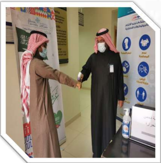
نقطة فرز مبنى العمادة