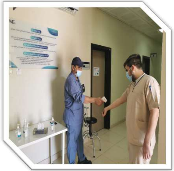
نقطة فرز قسم الهندسة الميكانيكية