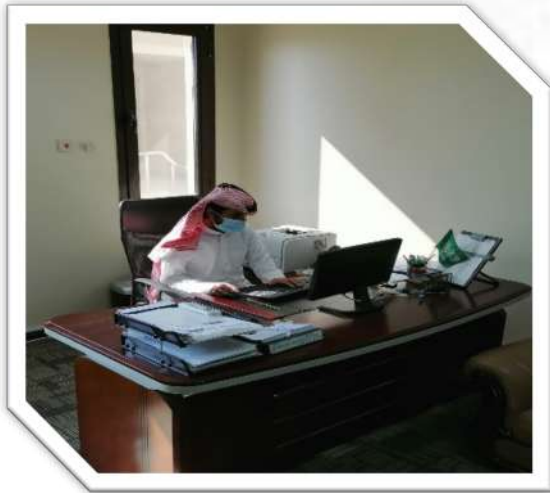
التزام جميع الموظفين بارتداء الكمامات