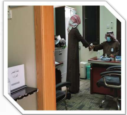
قياس درجة حرارة الموظفين والمراجعين