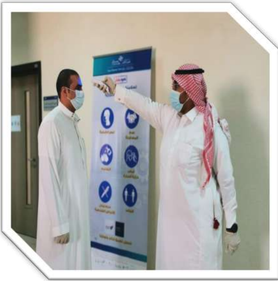
نقطة فرز قسم الهندسة الكهربائية