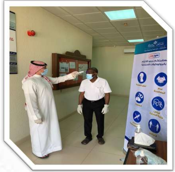
نقطة فرز قسم الهندسة المدنية